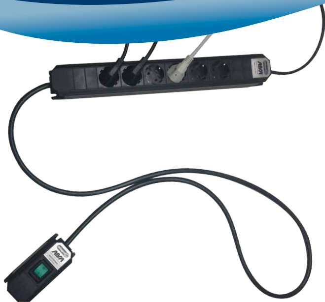
Octagon-Power-Leiste mit externem Schalter Produkt-Variantenübersicht: